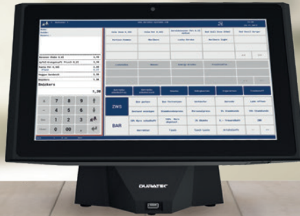
DURATEC POS S14