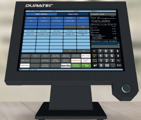
DURATEC POS S15 II

Immer eine gute Wahl: professionelle, stationäre Kassen von Duratec. Alle Modelle sind flexibel, intuitiv zu bedienen und das zu einem äußerst fairen Preis.