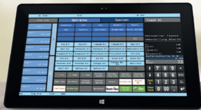
DURATEC POS PC